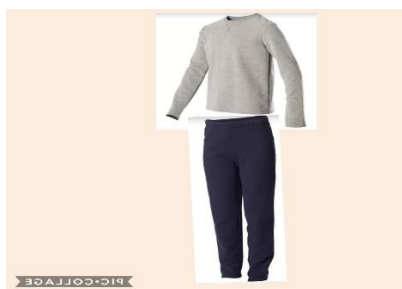
Modelo de chándal nuevo.

-Hemos decidido cambiar el modelo de chándal para las actividades de Educación Física de Primaria, que podéis encontrar a muy buen precio en Carrefour, Kiabi, ... ya que consta de: un pantalón azul, una sudadera color gris (que deberá llevar el escudo del colegio) y polo blanco. El modelo nuevo convivirá con el antiguo durante este curso 2020/21, es decir, podrán usar ambos durante el presente curso.